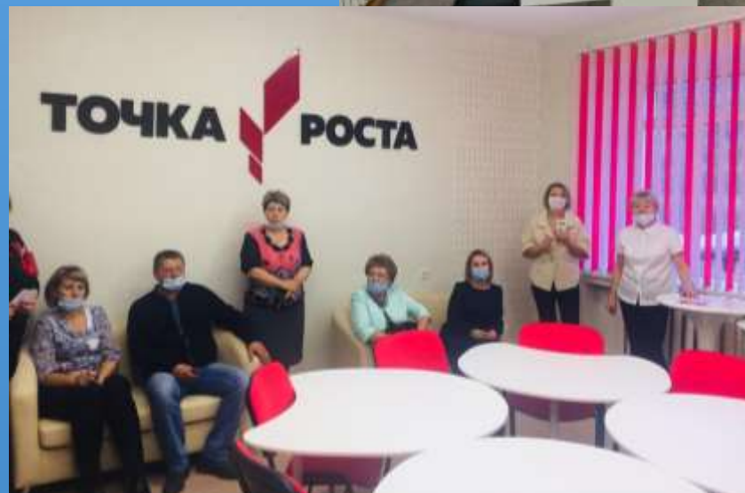
МБОУ «СОШ №9 г.Алдан»