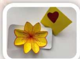
Открытка своими руками